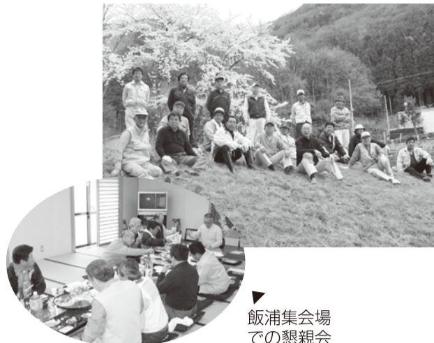
飯浦集会場での懇親会