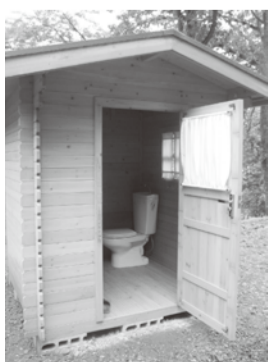
▼トイレも完成しました