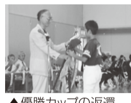
▲優勝カップの返還