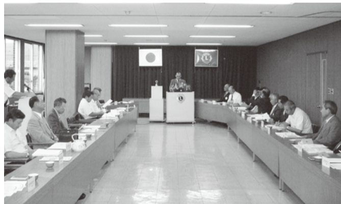
▲本年度より、会場がこのスタイルになりました。