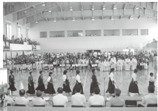
▲入場行進(伊香体育館)