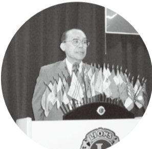
▲7L・RC L小漆間 (能登川LC)の 表敬訪問を受ける